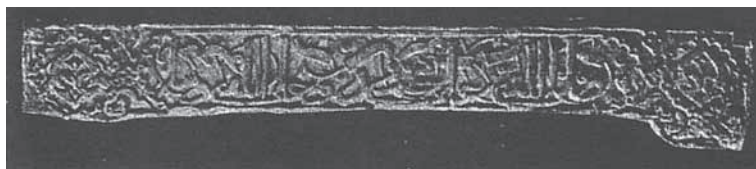
FIGURA 6. Restos de yesería de Santa Clara la Real en Murcia.

h) Otra de las inscripciones que estudia en Santa Clara, también en caracteres cursivos africanos se reduce a la frase: «La prosperidad continuada», y como la anterior las sitúa cronológicamente entre los siglos XIII-XIV 33 .