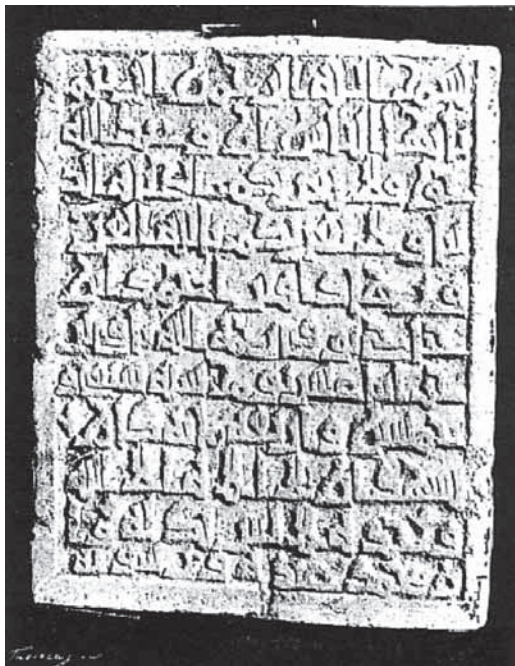
FIGURA 5. Lápida sepulcral de Ahmed Ibn Jatach en escritura cúfica descubierta en Murcia y estudiada por Rodrigo Amador de los Ríos en el Gabinete de Antigüedades de la Real Academia de la Historia.

En cuanto a los epígrafes murcianos, Rodrigo estudió un total de once inscripciones arábigas, publicadas en la Memoria de algunas inscripciones de España y Portugal (1883), en el Museo Español de Antigüedades (1876-78), en la obra Murcia y Albacete (1889) y en el Boletín de la Sociedad Española de Excursionistas (1897-98). A nivel histórico la aportación es escasa debido a que la mayoría de las inscripciones no tienen un lugar de procedencia exacto, siendo estudiadas por Rodrigo en los museos o en las casas de los propietarios. A nivel arqueológico