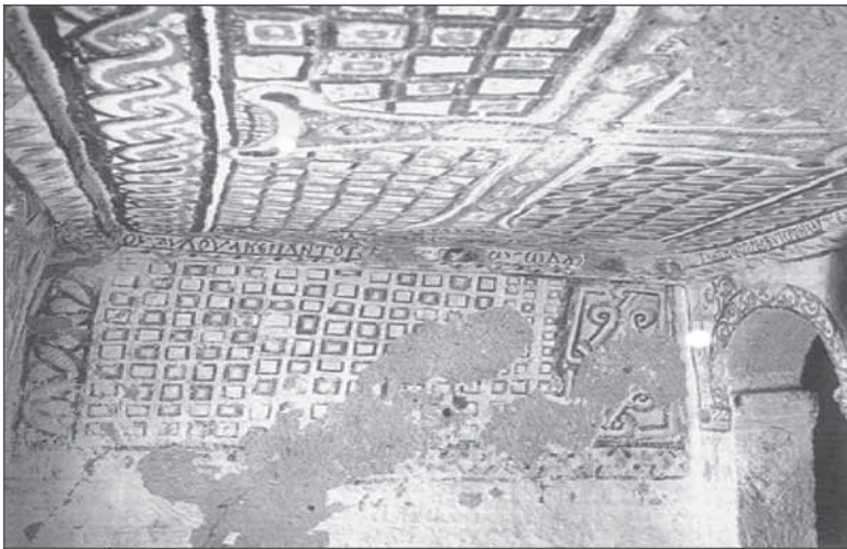
FIGURA 2. San Basilio, nave sur, vista al oeste