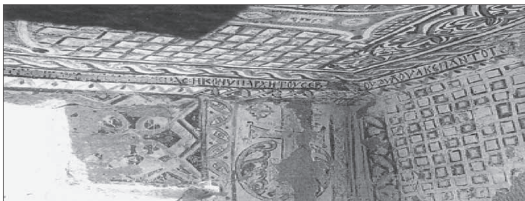
FIGURA 3. San Basilio, nave sur, parte occidental de la pared sur

bien puede pensarse en el siglo X 5 . La decoración consiste fundamentalmente en cruces o en paneles que enmarcan cruces, las cuales están rodeadas de motivos vegetales y geométricos. Este tipo de decoración de diseño geométrico y motivos florales no constituye ninguna excepción en Capadocia, donde muchas capillas la componen 6 .