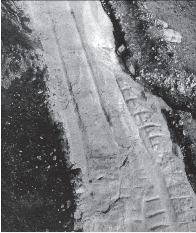
LÁMINA 21: Acceso al Tolmo de Minateda (Abad Casal, Gutiérrez Lloret y Gamo Parras, 2004)

en vano, la configuración vista, limitaría su conservación a intervenciones de escaso calado, fácilmente asumibles, como drenajes, y la simple retirada de limos 19 .