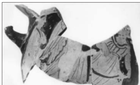
FIGURA 3: ARV 1469.148 BIS, Ferrara T.758, attribuito da Beazley al Gruppo G. Da notare la figura femminile sulla sinistra ed il particolare dell'ala.

di un possibile erote; una variante iconografica ipotizzabile, sulla base dei confronti con i soggetti raffigurati nei vasi decorati da questo gruppo ed in particolare con il cratere conservato al Museo di Spina 11 (FIG. 3), prevede alla destra della figura alata un'altra donna. La scena s'inscrive nel vasto e complesso mondo dominato da Eros e dalle sue creature, non molto popolare, in effetti, nell'iconografia della ceramica attica di IV secolo. Dall'analisi effettuata 12 sui duecento sessantuno vasi provenienti dalla Penisola Iberica presenti nelle liste Beazley, possiamo affermare che tale soggetto appare, durante il IV secolo, soltanto in tre esemplari 13 , mentre sono una ventina quelli che, all'interno del Gruppo G, sono decorati con immagini riferibili a momenti della vita quotidiana con eroti e Nikai .