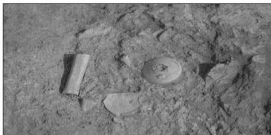
FIGURA 1: Il settore N-62, U.S. 82.

Il pezzo recentemente scoperto proviene dal settore N-62: una zona limitrofa ai resti di un edificio rettangolare ( estancia 3 ) e di uno spazio aperto provvisto di silos ; associata allo stesso strato è stata rinvenuta una « jarrita » biansata, la cui datazione contribuirà al perfetto inquadramento cronologico del livello. (FIG. 1)