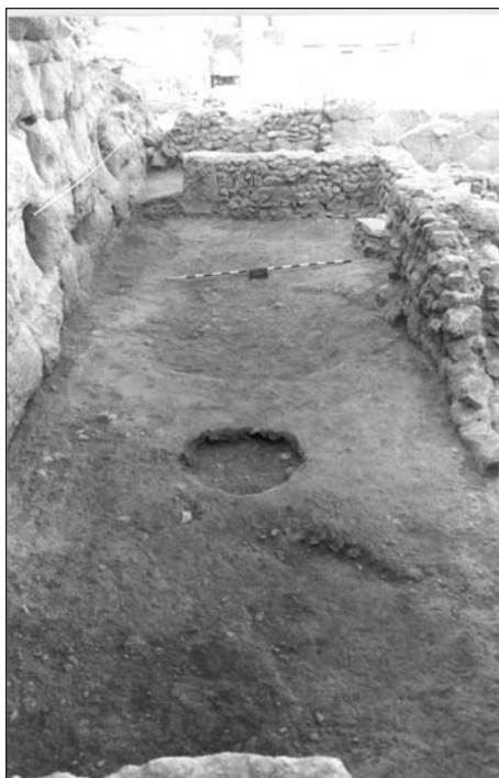
FIGURA 2: Habitación n° 30 del barrio de época bizantina, compartimentando el aditus del antiguo teatro romano (Archivo de la Fundación Teatro Romano de Cartagena).