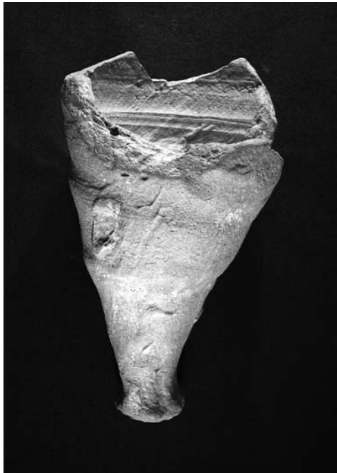
FIGURA 4: Ephesian early bizantine amphoriskos hallado en Cartagena .