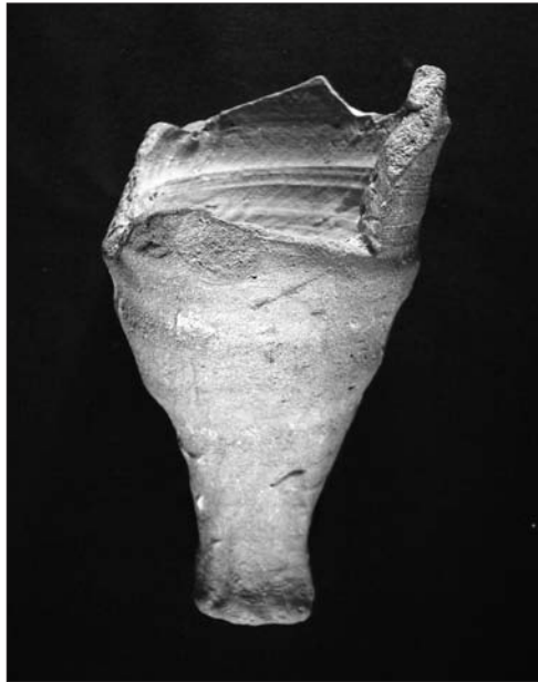
FIGURA 3: Ephesian early bizantine amphoriskos hallado en Cartagena .