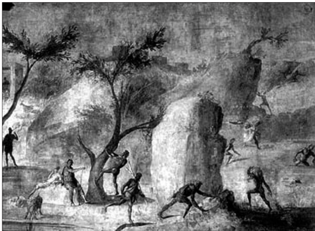
I. Ataque de los Lestrigones. Museo Vaticano, Roma.

la Iliada (XXIII 744) Homero ya había alabado al pueblo fenicio por su dominio de la orfebrería y la navegación 47 . Pero ahora también se destaca el carácter taimado y rapaz de sus habitantes ( Odisea XIV 288-95; XV 415, 419). Este cambio en la estimación del pueblo griego hacia los fenicios tuvo que producirse en un momento en el que la rivalidad entre ambas naciones por el control de las rutas comerciales había alcanzado su cenit 48 , una fecha posterior a la que comúnmente se suele utilizar para fijar la composición oral de los poemas.