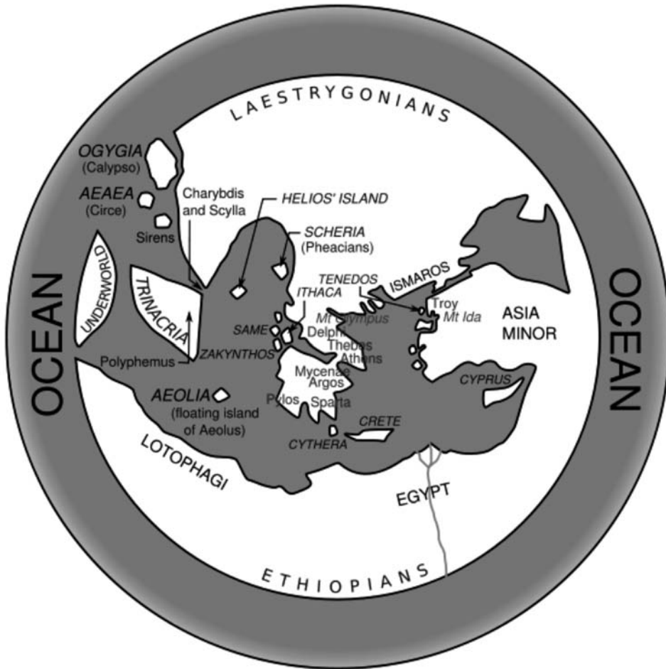
2. El mundo de Homero.

El Océano de Homero (fig. 2) es un río circular, sin principio y sin fin porque desemboca en sí mismo 57 , siendo el origen de « todos los ríos, todo mar, todas las fuentes y todos los pozos profundos » ( Iliada XXI 196ss). De igual modo, la descripción de Homero se inicia aludiendo al Océano 58 y concluye en él 59 . El río Océano no sólo simboliza una frontera entre el mundo habitado y los confines de la tierra, también lo es entre el mundo de los vivos y de los muertos. Odiseo debe navegar por sus corrientes para alcanzar el inframundo ( Odisea X 508). Más allá