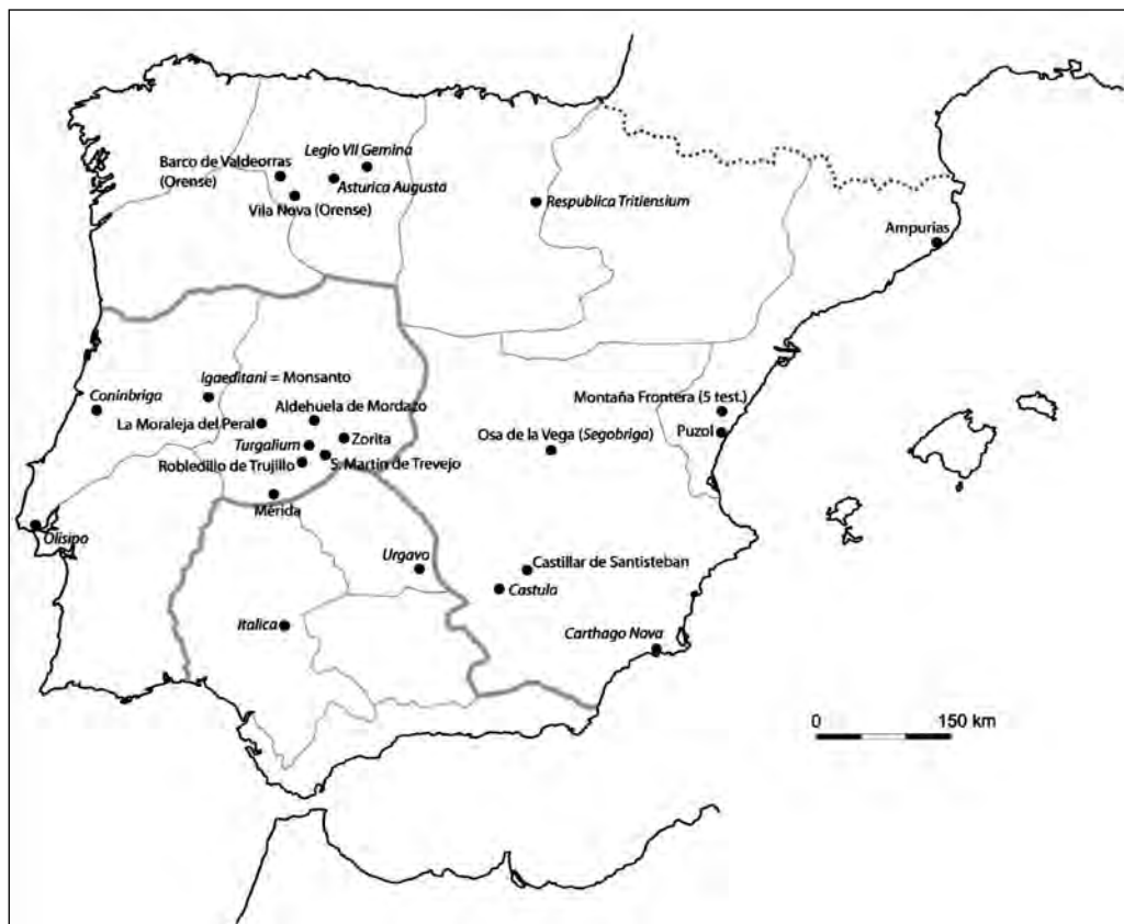
FIGURA 1. Lugar de hallazgo de las dedicatorias hechas a Liber . Mapa tomado de J. Del Hoyo Calleja, op. cit. , p. 90, al que hemos añadido los últimos hallazgos de Ampurias, Osa de la Vega y Mérida.

El hipercriticismo de Hoyo Calleja es corregido en la edición del fascículo 14 del CIL II2 . Aunque son sólo seis las inscripciones en las que se puede leer el nombre de Liber , ya sea abreviado o restituible a pesar de la fragmentación (nº 656, 658, 659, 663, 664 y 669), se reúnen treinta y una en el capítulo del santuario de Liber en Muntanya Frontera. En la praefatio (p. 126) se citan los trabajos de Corell, incluido el de 1992, y explica que las inscripciones escritas en caracteres ibéricos prueban el origen indígena de este lugar de culto. Se advierte de la posibilidad de que algunos de los fragmentos pertenezcan a una misma inscripción, y quince se encabezan con interrogación, pero, pese a todo, se considera verosímil que todo el material hallado en este lugar está relacionado con Liber 12 .