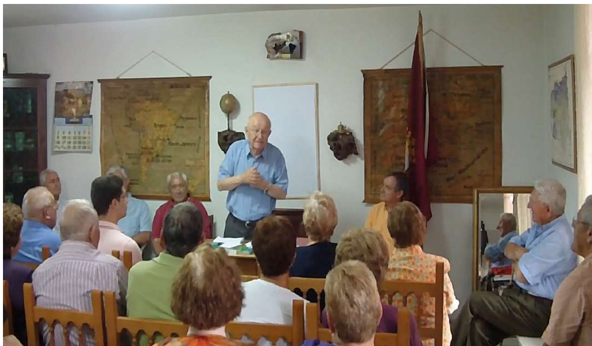
Conferencia en Paladín-Valle de Samario-Omaña (León)

Casi todas las localizaciones pertenecen al extremo norte del cordal de Peña Sagra, nuestro Monte Medullio, al que solo se le ataca por alto, a reserva del recurso al foso circular, el último recurso. Recordamos que, después de la conquista, Augusto recolocó a los cántabros en los que habían sido campamentos romanos, nos dice Floro (II, 33, 49). La misma prestancia de los campamentos hubo de refluir en las poblaciones en que se convirtieron.