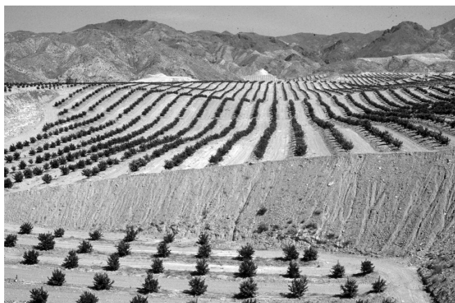
Figura 7. “Descabezado” y “emparejado” de terrenos forestales en el bajo Almanzora, al pie de Sierra de Almagro