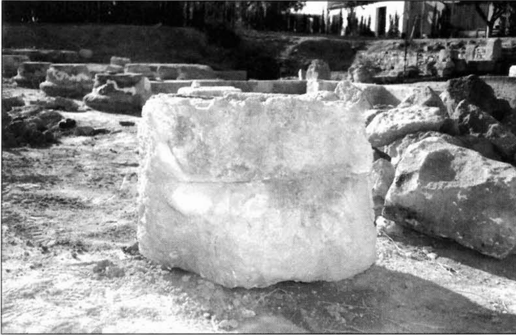
FIGURAS 4 Y 5. Aspecto de las otras caras del elemento.