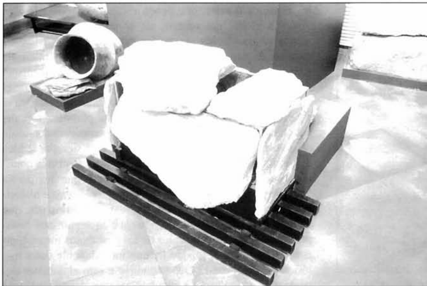
LÁMINA IV. Enterramiento en cista de El Puntarrón Chico, en la actual sala de El Argar.

pero de manera tal que no se altere su verdadero carácter ni la personalidad que le da el hecho de ser un museo arqueológico regional y, al mismo tiempo y en buena medida, local.