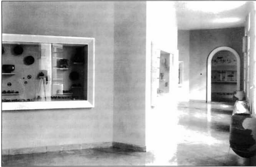
LÁMINA III. Sala y vitrinas de las dependencias actuales.