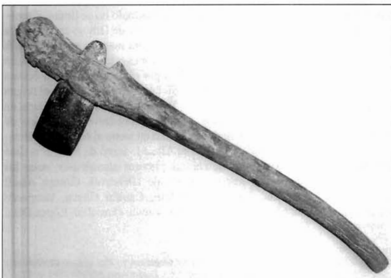
LÁMINA 5. Hacha enmangada de los Blanquizaes de Lébor (Museo Arqueológico de Almería).