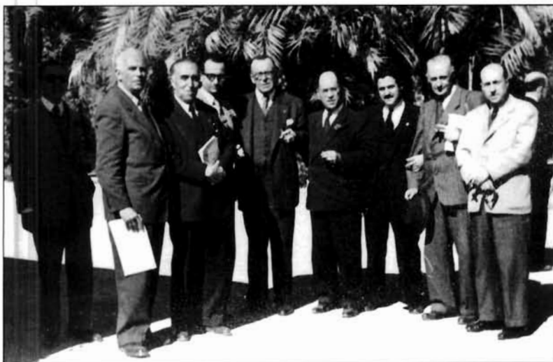
LÁMINA 4. IV Congreso de Arqueología del Sureste (Elche 1948).