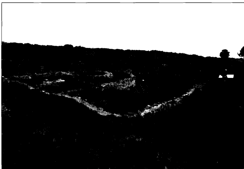
LÁMINA 1. Yacimiento vistable cubierto de vegetación.

Particularmente pensamos que ambos fenómenos no son más que manifestaciones conspicuas de una forma socio-política específica: la de los estados occidentales del capitalismo avanzado, bajo los que se abriga la denominada sociedad de consumo y del bienestar . Para sostener esta afirmación trataremos de mostrar que: