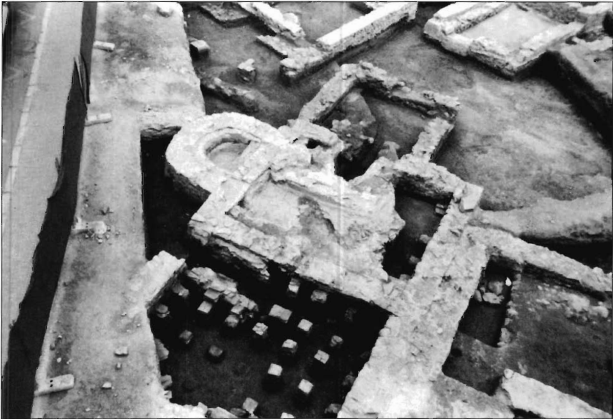
LÁMINA 1. Vista cenital de las termas orientales.

agua potable subterráneo, que debió aprovecharse en época romana.