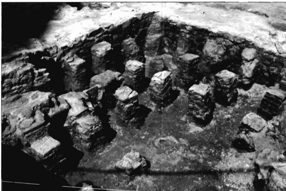
LÁMINA 4. Hipocaustum (Espacio 20), Fase II.