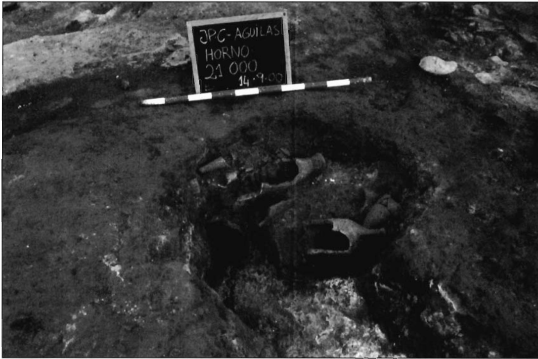
LÁMINA 5. Horno de anforillas, Fase III.

Águilas ya contaba con otro conjunto termal, situado unos 200 m al oeste de las descritas, que data de la segunda mitad del s. I d.C. y se abandona en el s. IV d.C. Ambas presenta un total paralelismo en cuanto a su evolución, utilización y transformación, en época Bajo-imperial. En este sentido comentamos algunos de los rasgos de las primeras termas que se localizaron en el casco urbano de Águilas, denominadas por su situación como las Termas de Occidente.