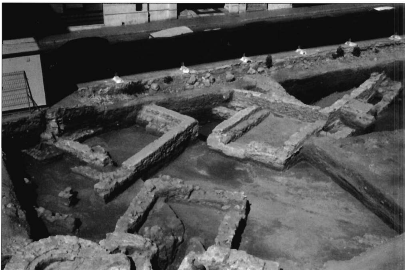
LÁMINA 2. Sector oeste de la excavación, evolución y transformaciones de los espacios 1, 2, 3, 4, 7, 11, 15.