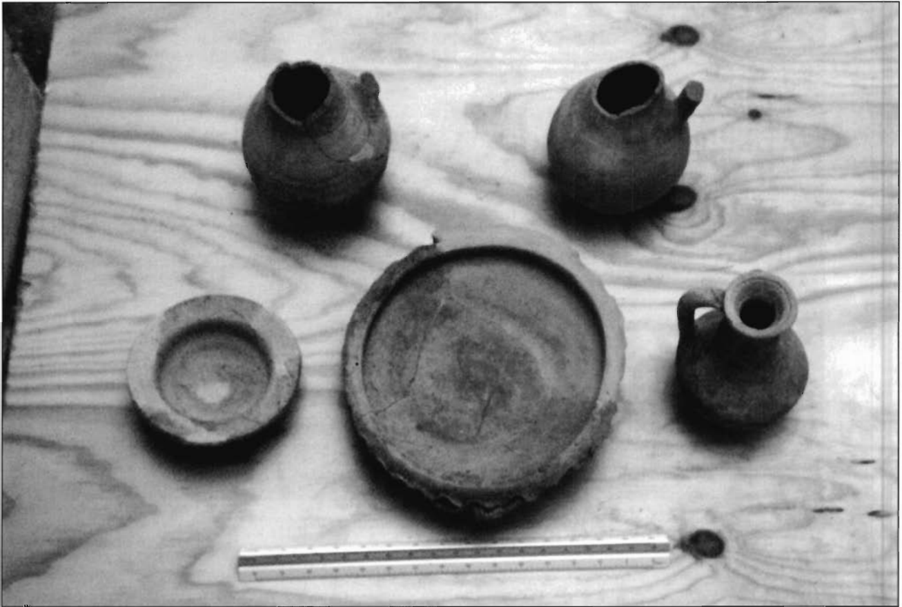
LÁMINA 6. Recipientes característicos de la vajilla de mesa, Fase III.

los que responden a la traza lineal – angular, ya que se adaptan mejor a la trama urbana existente, al presentar plantas más o menos cuadrangulares.