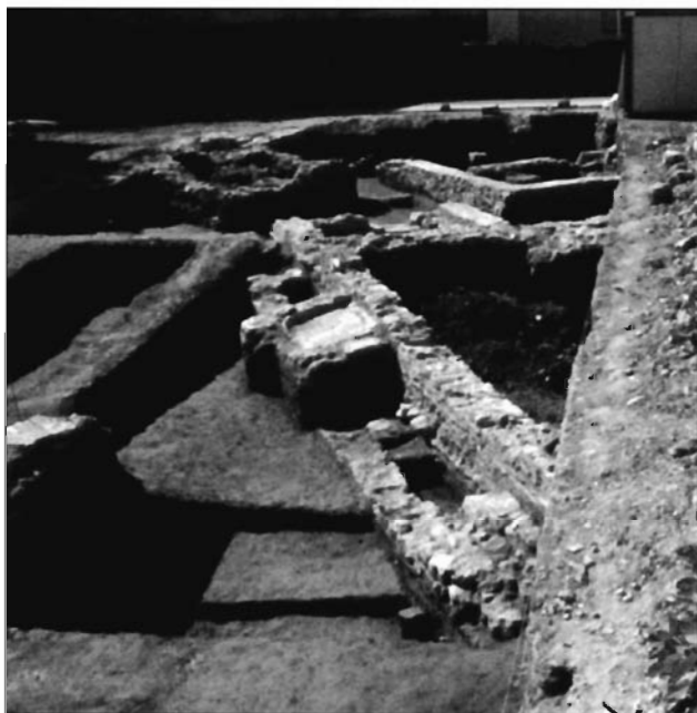
LÁMINA 3. Ángulo sureste de la piscina vinculada a las termas, utilizada en la última fase, como balsa de decantación de arcilla.

simbólicamente a los tres elementos fundamentales de la vida: tierra, agua y aire.