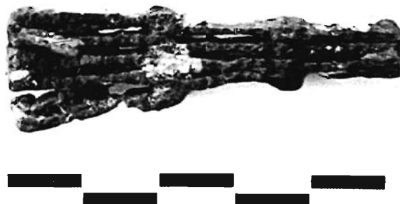
Lámina 4. Espuela articulada de la Sep. 70 de Coimbra. Museo de Jumilla.

El principal problema que plantea el contexto arqueológico de esta espuela es que parece indudable que la Sep. 70 fue un enterramiento de ajuar claramen-