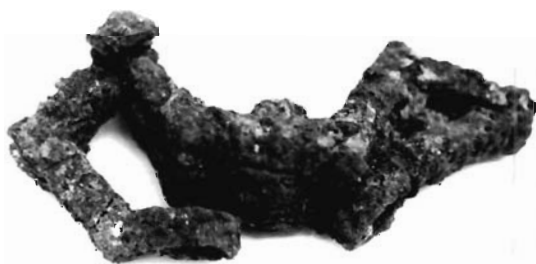
Lámina 3. Espuela articulada de la Sep. 277 del Cigarralejo. Museo de Mula.

La espuela procede de una de las dos tumbas más ricas de todo el yacimiento –por ajuar y volumen de su estructura tumular–. Se trata de la Sep. 277 (Cuadrado, 1968; ver al respecto Quesada, 1998, especialmente p. 204). Se trata como es sabido (Cuadrado, 1987 p. 470ss.) de una tumba doble, con un enterramiento masculino y otro femenino, todo ello sobre una sepultura anterior masculina destruida por la 277 a la que al parecer sólo correspondería una falcata. Aunque Cuadrado no la identificó con certeza, en la Sep. 277 se halló un fragmento de otra espuela de tipo rígido en hierro (Cuadrado, 1987, p. 483, fig. 209.28, nº inv. 2863bis; nº cat. Quesada 639) (fig. 1.C). Esto hace que en la tumba se encontraran, amén de un bocado de caballo completo de embocadura articulada, dos espuelas de tipos por completo diferentes. Aunque nada impida en teoría que cada una se atara a un tobillo, cabe en mejor lógica pensar que corresponden a momentos o personas diferentes. Lamentablemente no tenemos información sobre la asociación exacta de cada una de estas dos espuelas a uno u otro de los tres nichos hallados bajo el empedrado tumular.