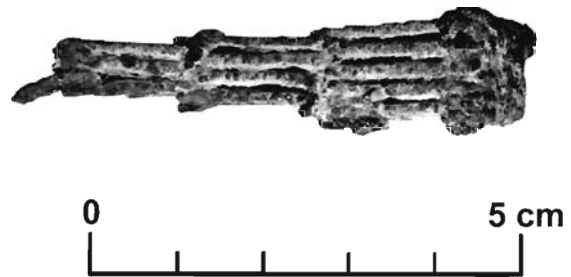
Lámina 2. Espuela articulada procedente probablemente de la necrópolis del Cerro del Santuario de Baza (Granada). Vista lateral. Museo de Baza.

aprecia perfectamente (lám. 2) el arranque de uno de los dos anillos terminales de bronce que, unidos a los segmentos anteriores por un pasador férreo idéntico a los anteriores, constituían los últimos segmentos articulados que servían para pasar la correa de cuero que ataba y fijaba la espuela al tobillo (ver fig. 1.A). Extendida la pieza debía medir, completa, unos 15,8 cm de extremo a extremo de los anillos.