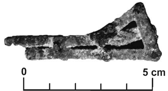
Lámina 1. Espuela articulada procedente probablemente de la necrópolis del Cerro del Santuario de Baza (Granada). Vista superior. Museo de Baza.