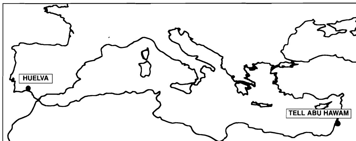
Figura 1. Localización de Tell Abu Hawam y Huelva.

miento en la Edad del Hierro, al que seguiría una interfase durante la cual la pequeña isla quedaría desocupada hasta un nuevo asentamiento que se inicia y perdura durante el período Persa-Helenístico.