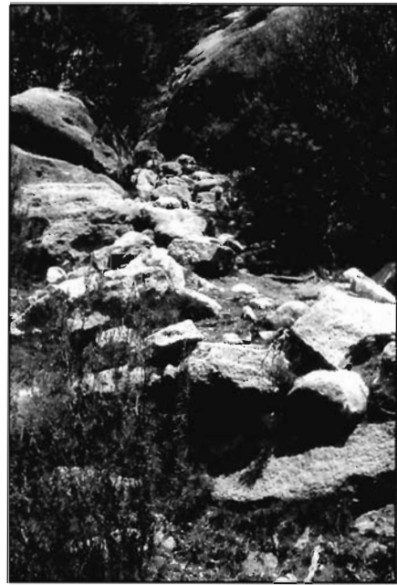
Lámina 4. Pasadizo angosto de acceso a la cima salpicado de escalones aislados.

La actividad económica se manifiesta a través de las actividades ganaderas, cinegéticas y comerciales que se documentan a través de los hallazgos fabricados en las diáfisis óseas de la fauna doméstica y salvaje como son los útiles de adorno, cuentas de collar y puntas de flecha.