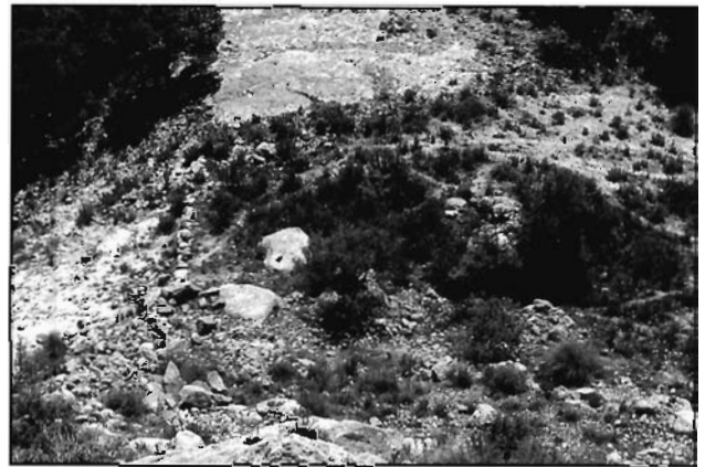
Lámina 5. Posible aprisco similar a los del Oficio, La Bastida e Ifre.