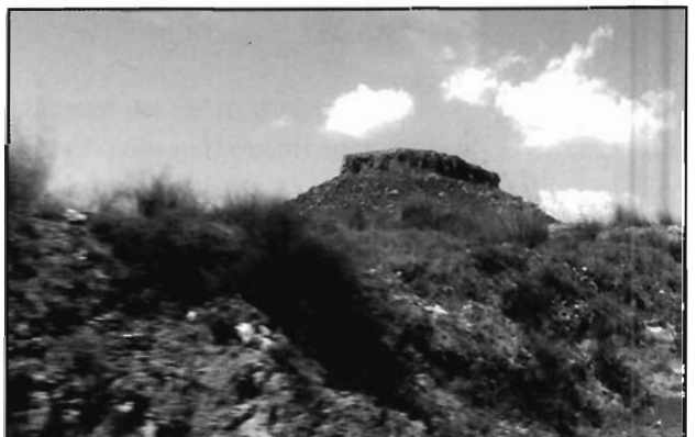
Láminas 2 y 3. Vista general del poblado de La Almoloya.