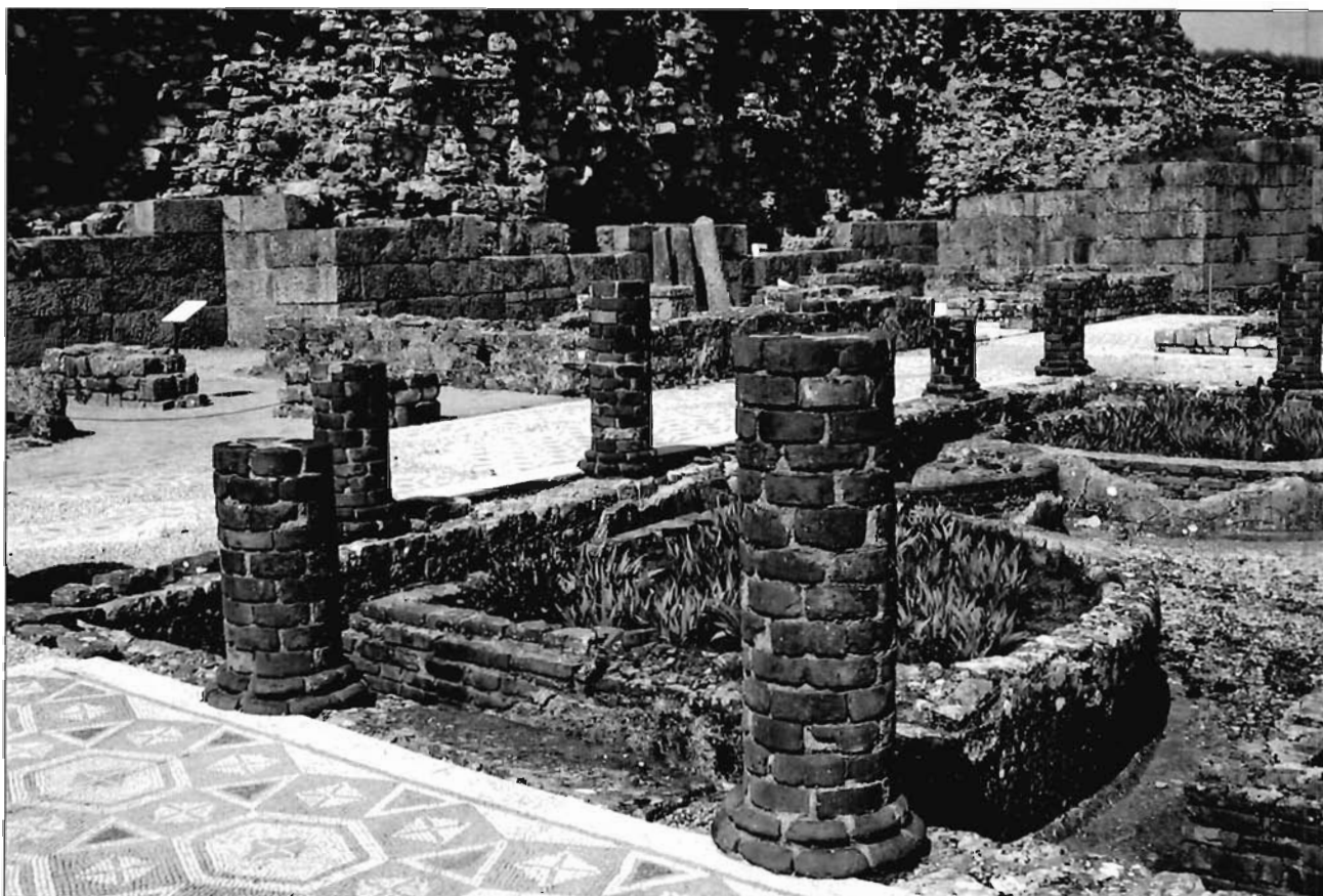
Lámina 9. Detalle de una de las jardineras del peristilo de la Casa de las Evaslicas de Conimbriga.

Tarraco 23 , el conjunto de piezas procedentes de Cor-duba 24 , el grupo escultórico del estanque de la villa de la “Casilla de la Lámpara” (Montilla, Córdoba) del que formó parte una estatua-fuente con la representación de un sátiro con odre en mármol y una pantera de bronce