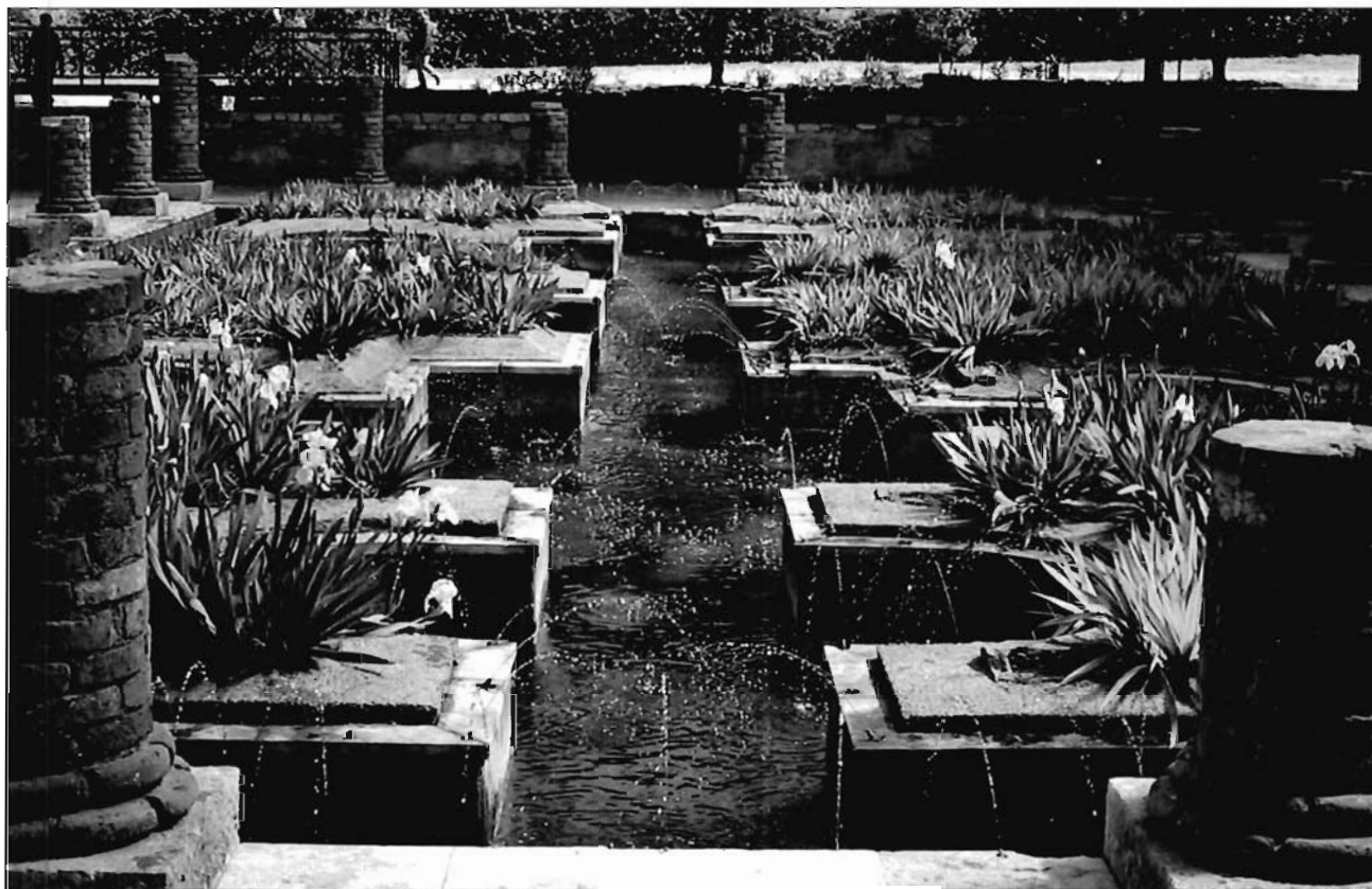
Lámina 6. Peristilo de la Casa de los Repuxos de Conimbriga.

el triclinium de la domus sino muy probablemente el gran salón de recepción u oecus 15 (lám. 5). La incorporación de los espacios acuáticos a los peristilos domésticos —estanques, fuentes, ninfeas...—, supuso cambios importantes en la articulación misma de este ámbito ajardinado focalizado en torno a ellos y condicionado por su tamaño y diseño (Jashemski, 1979 y 1993; Ricciardi et alii , 1996). En el caso de los estanques que muchos de los peristilos incorporaron en su interior las posibilidades formales son tan amplias como el gusto de los propietarios y los medios —