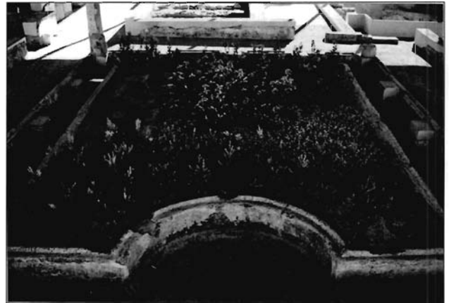
Lámina 10. Peristilo de la Casa del Mitrreo de Mérida.

Fue también el peristilo doméstico el escenario para ciertas actividades cotidianas. La presencia en su interior de cierto mobiliario –mesas, bancos, klinai , pérgolas– junto con la existencia de restos orgánicos (huesos