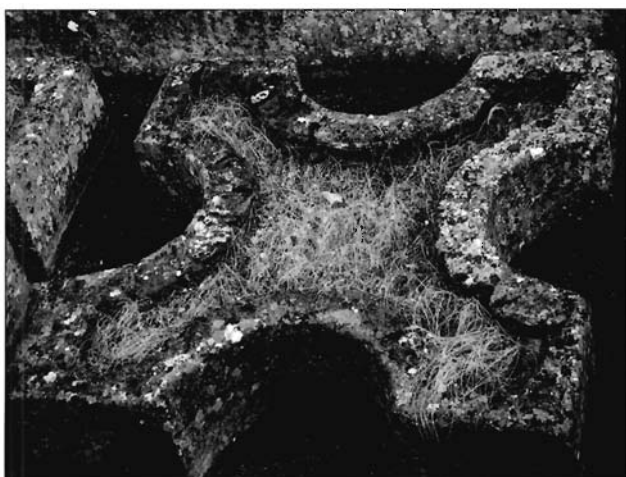
Lámina 11. Detalle de una de las jardineras de un patio secundario de la Casa Cantaber de Conimbriga.

el seno del peristilo o en los corredores aledaños a este espacio ajardinado, pequeños altares domésticos. Es este el caso del lararium de la Casa de los Pájaros de Itálica del que se conserva los restos de un pequeño nicho pavimentado en mosaico sobre el que se instaló el altar 52 , o, en el interior del propio peristilo, el ara de culto doméstico decorada con pinturas –con la representación de un gallo, una serpiente, una piña y una cratera– procedente de la Casa 2B de Ampurias.