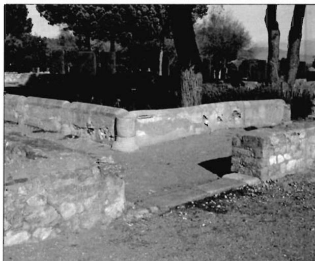
Lámina 3. Detalle del cierre de uno de los espacios ajardinados de la Casa 2B de Ampurias.

la Casa Taracena de Clunia (Taracena, 1946, 29-69), la Casa 1 y 2B 9 de Ampurias, las emeritenses casas del Anfiteatro y del Mitreo 10 o la Casa Cantaber de Conimbriga que contó, en su último momento de uso, con cinco ambientes ajardinados distribuidos por distintos sectores de esta excepcional residencia 11 (lám. 4).