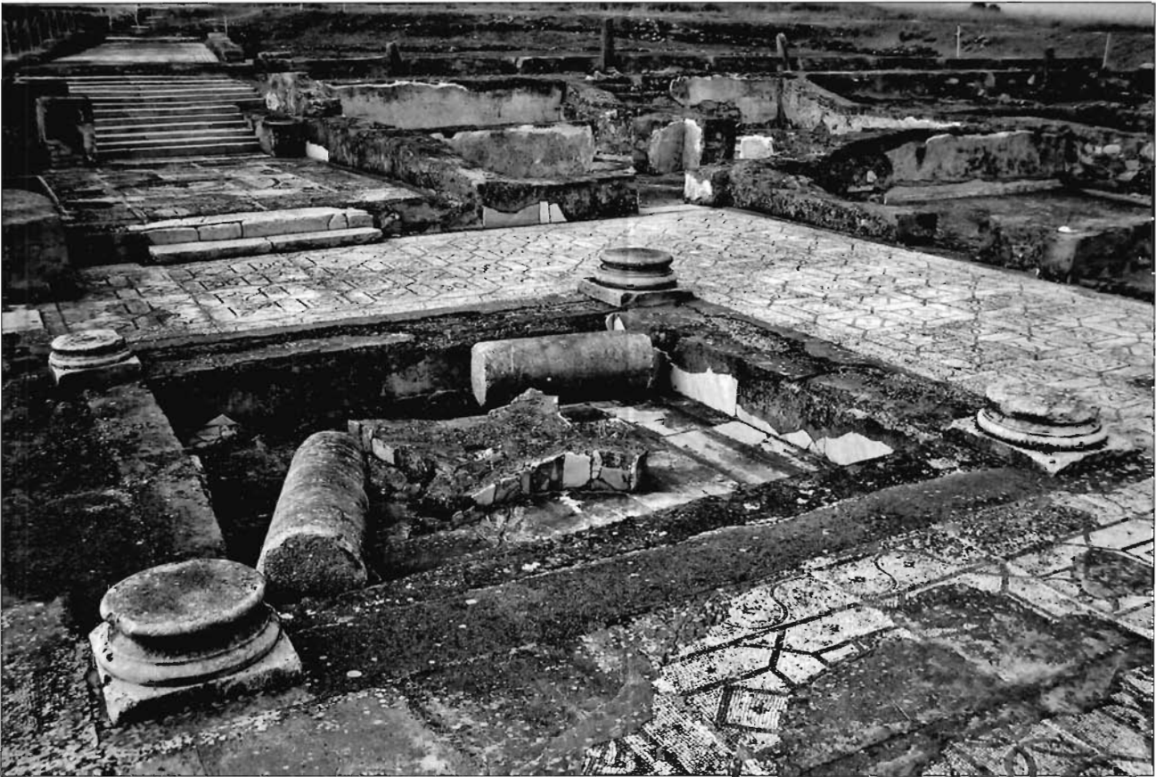
Lámina 8. Plataforma de la fuente del estanque de la villa de Pisões (Beja).

tera del Puerto” de Tarragona 20 , en la “Huerta Cardosa” de Córdoba 21 o en la localidad de Cantillana, antigua Naeva (Loza Azuaga, 1993, 101; Beltrán, et alii , 1993, 62-82), todas ellas procedentes, muy probablemente, de jardines domésticos. También adscribibles a un contexto ajardinado privado son las estatuas-fuente,