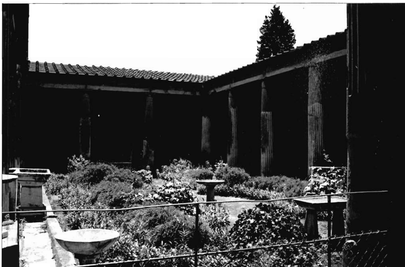
Lámina 1. Peristilo de la Casa de los Vetii (Pompeya).

tilo no fue sólo el ámbito de la vivienda que acogía una naturaleza domesticada, fue, junto con el atrium 5 , el corazón mismo de la domus , foco de iluminación y aireación de todas las dependencias abiertas a él y zona de paso y comunicación entre todos los ámbitos de la casa. Así debemos entender las exedras que jalonan en ocasiones los flancos de los peristilos que se adecuan en su modulación, del mismo modo que los ritmos de las columnatas, a los vanos de las principales salas abiertas a este jardín – oeci , triclinia , cubicula , alae ,...–. El peristilo se conforma, además, como un