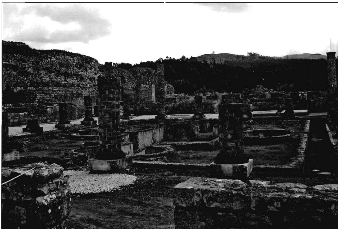
Lámina 7. Peristilo de la Casa de Cantaber de Conimbriga.

su revestimiento mármoleo 17 . Numerosos propietarios eligieron estanques tetralobulados que ocuparon el centro de los peristilos, pudiéndose configurar como simples estanques –leonesa villa de El Soldán 18 –, monumentales fuentes –la domus del gran peristilo de Asturica Augusta (Astorga) 19 , fuente de la villa de Pisões (Lám. 8)– o plataformas