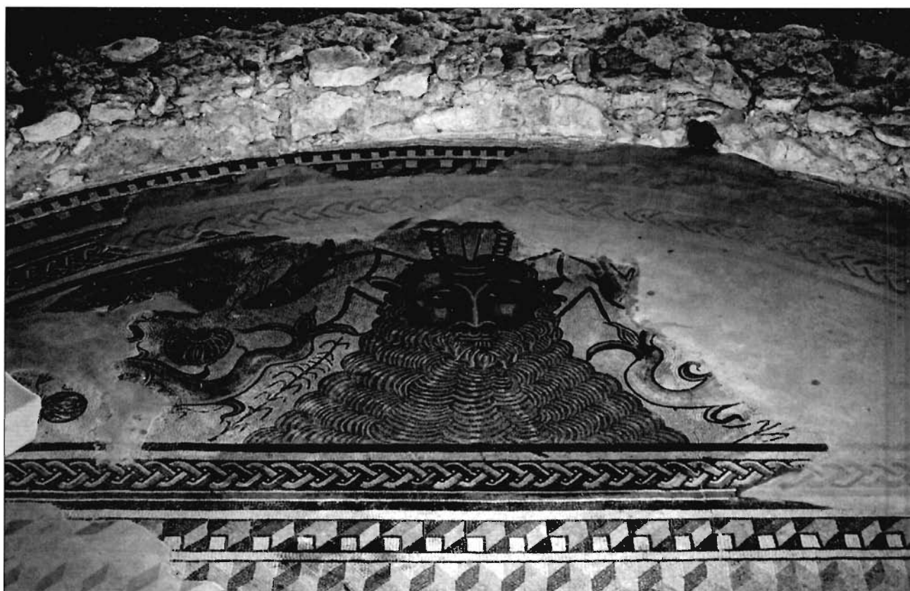
Lámina 5. Detalle de la exedra del corredor norte del peristilo de la villa de Carranque (Toledo) con la representación de Oceanos.

Pero la importancia atribuida al agua en el interior del peristilo romano convirtió estos espacios en auténticos juegos de agua, espacios de recreo y goce para sus propietarios en los que se multiplicaron los estanques, fuentes, fuentejillas y ninfeos (Grimal, 1944; Kapossy, 1969; Jashemski, 1979-1993; Farrar, 1998, 64-96; Balil, 1977; Loza Azuaga, 1993 y 1993c), quedando, en ocasiones, reducida al mínimo la superficie destinada a las plantas – viridarium – que pudieron estar suspendidas sobre los estanques a través de armaduras de madera y pérgolas o recludas en jardineras de mármol o mampostería – vid infra –. La presencia de fuentes y estanques de diversas formas y tamaños, en los que podían incluso cultivarse diversas especies de peces o representarse éstas mediante mosaicos de tema ictiográfico, era frecuente en los jardines y peristilos domésticos. En numerosas ocasiones la presencia de estos ricos mosaicos con la representación de una amplia gama de especies marinas solaron exedras localizadas en el peristilo –frente a espacios de prestigio de la domus como el oecus o el triclinium , esquema