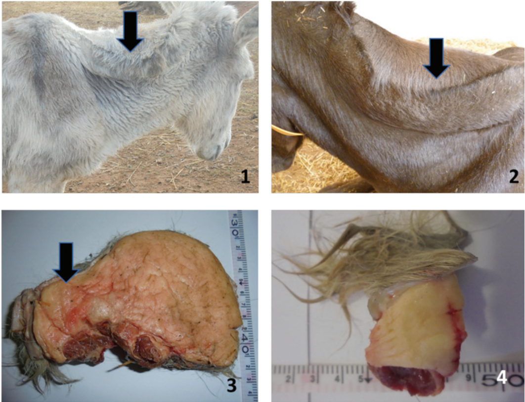
Figura 1. Burro con deformación del borde dorsal del cuello Puntuación 4. La cresta del cuello es tan grande que se cae permanentemente hacia un lado (Flecha). Figura 2.- Burro con deformación del borde dorsal del cuello Puntuación 5. La cresta es tan grande que se cae permanentemente hacia un lado (Flecha). Figura 3.- Disección del tejido graso del borde dorsal del cuello Puntuación 5. La cresta es tan grande que se cae permanentemente hacia un lado (Flecha). Figura 4.- Toma de muestra del borde dorsal del cuello Puntuación 5. Figura 5.- Cortes histológicos de la región dorsal del cuello Puntuación 4.- células adiposas maduras entre las fibras musculares vacuolas de grasa abundantes en el espacio intermiofibrilar con tendencia a la coalescencia y con infiltración grasa en tejido muscular (lipomatosis marcada) (H&E 40x).

las Puntuaciones 4 y 5 de perímetro cervical, predominantemente 4 (56%) y 5 (44%). Las observaciones del perímetro cervical y desviación del borde dorsal del cuello directamente están asociadas con la obesidad de los burros estudiados, a mayor grado de obesidad mayor puntuación de perímetro cervical y mayor gra-