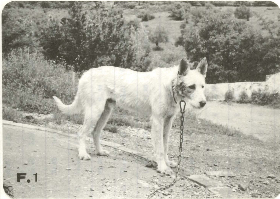
FIGURA 1. Ejemplar de Podenco Andaluz (macho, 1 año, Córdoba).

racial y, posterior mejora de esta subespecie de gran importancia en la práctica de la montería en nuestro país.