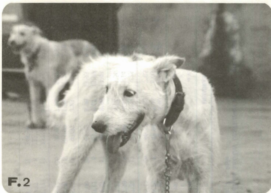
FIGURA 2. Detalle de la cabeza de un Podenco Andaluz (hembra, 3 años, Córdoba).

mismo tiempo. En estas provincias hemos encontrado ejemplares aislados dentro del patrón racial que proponemos.