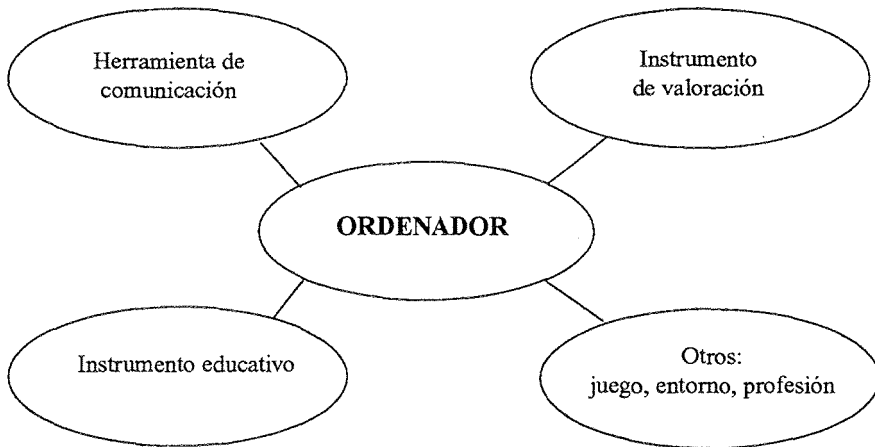
FIG. 1. USO DEL ORDENADOR.