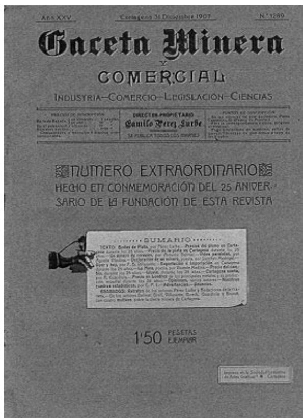
Cabecera de la Gaceta Minera y Comercial