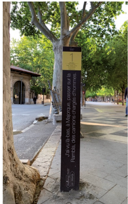
Figuras 1 y 2: Baliza situada al inicio de Las Ramblas de Palma, que contiene la cita de George Bernanos. Es visible el código QR desde el que descargarse bien la cita, bien la aplicación entera.

Se ofrecen siete rutas (Figura 3) correspondientes a siete áreas geográficas bien delimitadas. Al seleccionar una, el turista tiene acceso a una breve introducción de la misma y a un listado de escritores relacionados con el lugar (Figura 4 – Ruta 4: Paisajes literarios de Tramuntana);