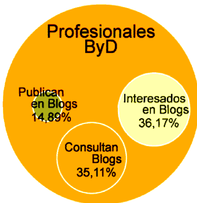
Gráfico 1. Uso de blogs por profesionales ByD.

En relación al uso que los profesionales de la ByD hacen de los blogs, un 35,11% consultan blogs ByD, un 14,89% publican o han publicado contenidos en algún blog ByD y un 36,17% han mostrado interés por ser informados del resultado de este trabajo.