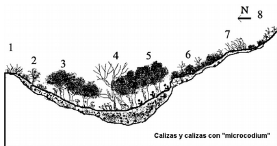
Figura 2. Geosigmetum de las principales comunidades vegetales en la zonopotencialidad de los encinares de Paeonio coriaceae-Querceto rotundifoliae S.

cir un aumento en precipitaciones (alcanzándose el ombrotipo subhúmedo) y de humedad edáfica. En esas zonas se hace notoria la entrada en el encinar de especies de Quercus-Fagetea , tales como Quercus faginea , Sorbus aria , Hyacinthoides hispanica o Geum sylvaticum , pero siendo siempre dominante el contingente de especies esclerófilas de Quercetea ilicis . Esta subserie representa en nuestro territorio de estudio el tránsito natural del encinar con quejigos hacia los quejigales relictos torcalenses mesofíticos de umbrías lluviosas de Vinco difformis-Quercetum fagineae var. de Quercus alpestris . El encinar mixto se acompaña de un pastizal esciohumícola de lindero de bosque, en suelos profundos y bien humificados, de Elymo hispanici-Brachypodietum sylvatici . La primera etapa de sustitución es un espinar-zarzal en el que puede ser dominante Crataegus monogyna y que, en suelos con hidromorfia, puede derivar a un zarzal con gayumbas de Spartio juncei-Rubetum ulmifolii . Los matorrales seriales de sustitución sobre suelos margoso-calizos están caracterizados por el aulagar de Genisto cinereae-Ulicetum parviflorii . Los pastizales seriales de lapiaz o de zonas karstificadas se corresponden a Helictotricho arundani-Festucetum capillifoliae , que, en zonas muy expuestas principalmente por