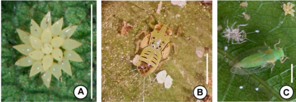
Figura 1. Estados de desarrollo de Platycorypha sp. A: Huevo; B: Ninfa; C: Adulto. Barra= 1mm.

Figure 1. Development stages of Platycorypha sp. A: Eggs; B: Nymph; C: Adult. Bar=1 mm