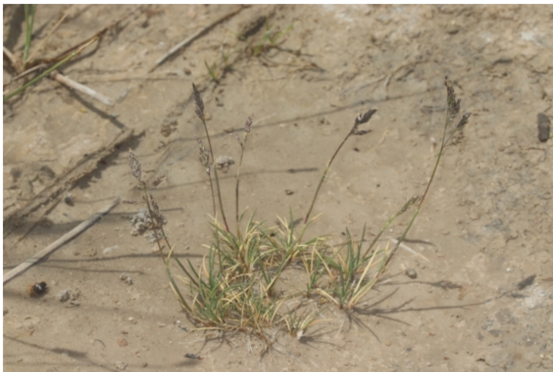
Figura 2. Puccinellia pungens , ejemplar murciano (junio 2020).