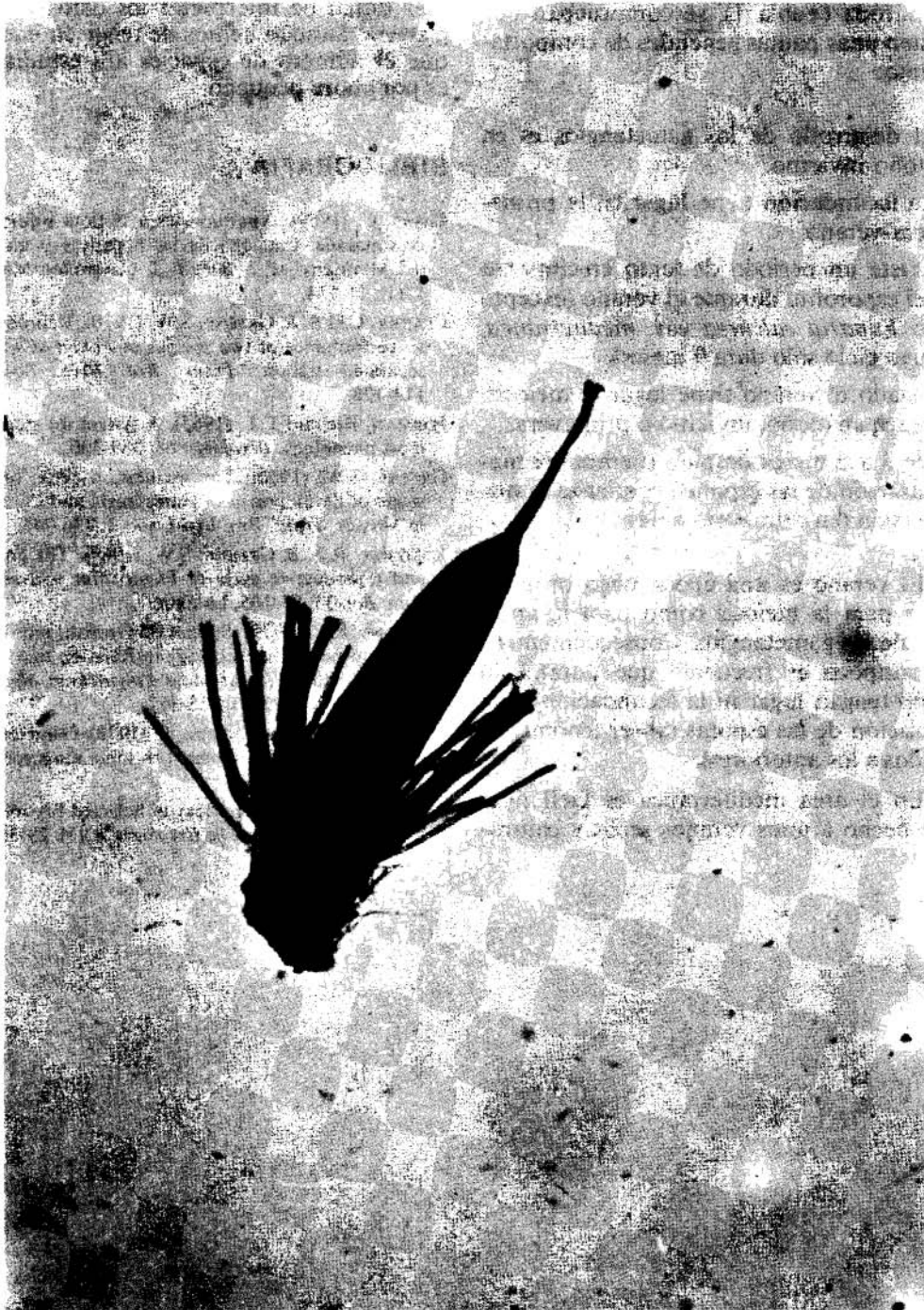
FIGURA 4: Inflorescencia femenina de Barramia pomiformis , con un arqueonio fecundado