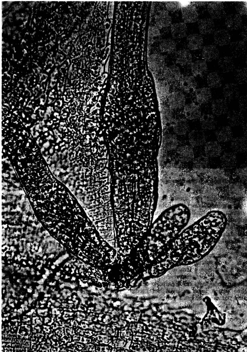
FIGURA 3: Arquegonios juveniles e imaduros de Hedwigia ciliata