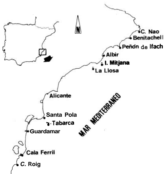
FIGURA 1. Localización de las estaciones de muestreo.

Se ha seguido en este estudio la metodología clásica, es decir, observación directa de los ejemplares, anotando el color y otros caracteres que podían modificarse después de la fijación, obtención de cortes y confección de preparaciones para observación mi-