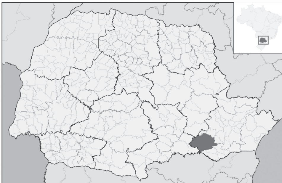
Figura 2. Municipio La Lapa en Paraná, ubicación del asentamiento "El Contestado".

uno de ellos es de agroecología (mixto de hombres y mujeres) y que se dedica a la producción colectiva de miel, y también se capacita en otras producciones, más del 50% de sus miembros de la cooperativa son mujeres. Otro grupo productivo "Fibra e Arte" se dedica a la producción de artesanías partir de la fibra de banana, todo su tratamiento es ecológico (formados por 7 mujeres y dos hombres). Para las mujeres miembros de grupos productivos, estos representan la posibilidad de socializar saberes, obtener otras fuentes de renda y la posibilidad de capacitarse.