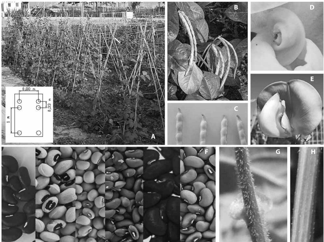
Figura 1. A) Marco de plantación. B) Legumbres. Nótese su posición en el extremo de largos pedúnculos. C) Ápice de las legumbres. D) Flor de judía común. Nótese la quilla enrollada. E) Flor de caupí. Nótese la flor completamente simétrica, con la quilla recta. F) Vaiabilidad de semillas de caupí. G) Tallo de judía común, con pelos uncinados. H) Tallo de caupí, glabro. I) Evolución de la superficie y producción del caupí en el mundo (1961-2004). Fuente: elaboración propia con datos de FAO.