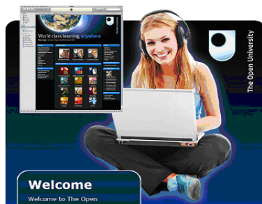
Figura 1 http://www.open.ac.uk/itunes/

9. Jenkins, M. Y Lonsdale, J. (2008). Podcasts and student's storytelling; in: Podcasting for Learning in Universities